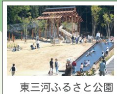
東三河ふるさと公園