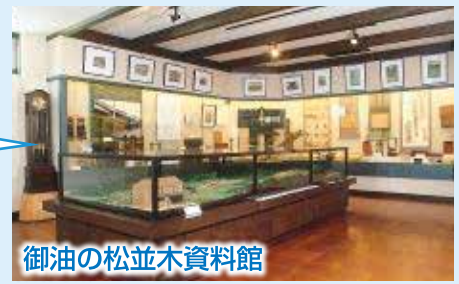
御油の松並木資料館