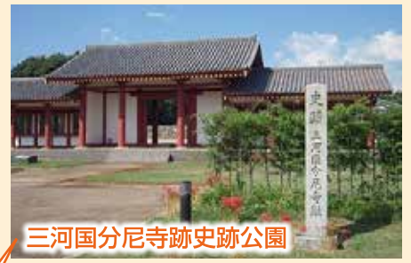
三河国分尼寺跡史跡公園

●天平13年(741)に聖武天皇が発した「国分寺建立の詔」により東大寺を総本山として諸国に建立。8世紀後半に完成。