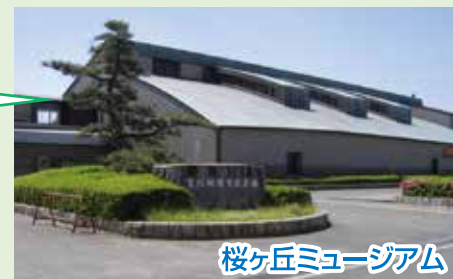
桜ヶ丘ミュージアム