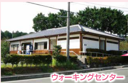
ウォーキングセンター

●登山道の案内マップなど情報を得る。 本宮山山岳ガイドによる登山ガイドも可能 (観光協会へ要予約) ※近くのコンビニで昼食も購入可能