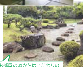
お部屋の窓からはこだわりの 日本庭園がご覧いただけます