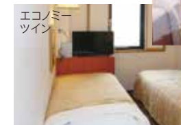
エコノミー ツイン