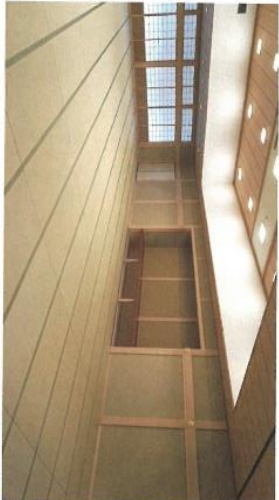
会議室(イス・テーブルの利用が可能です)