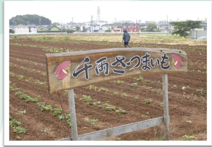
千両さつま芋掘り 300円