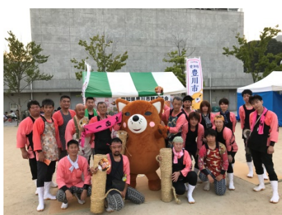
<とよかわ手筒花火奉納の皆様>

内容 豊川市観光PRブースにて、とよかわブランド、まつり、観光PR とよかわブランドとよかわ手筒花火うちわを1,000人に配布