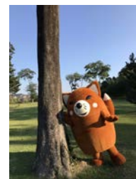
<豊川グリーンセンター> <豊川稲荷> <砥鹿神社> <御油松並木公園>