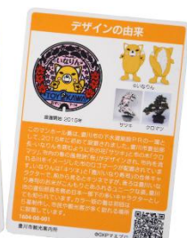
<いなりんマンホールカード>