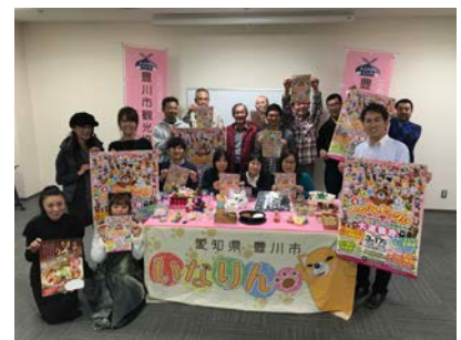
<観光物産展参加店記者発表の様子>