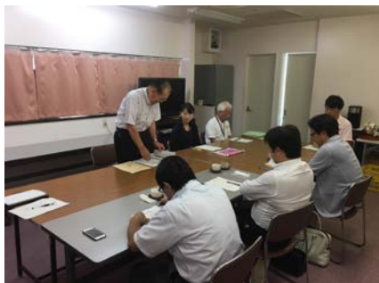
<正副会長会議の様子>