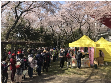
<3月31日JRさわやかウォーキングの様子>