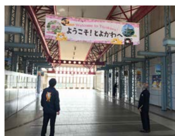
<11月1日エクスカーション歓迎準備の様子> <12月26日JR豊川駅自由通路設置の様子>