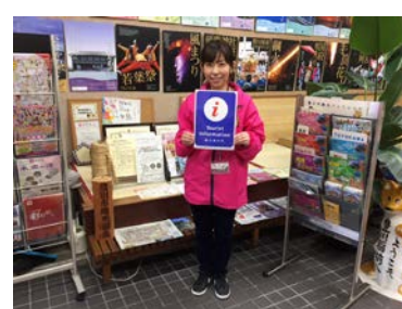
<外国人観光案内所認可ロゴとスタッフ>