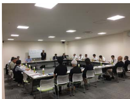
<理事監事会の様子>