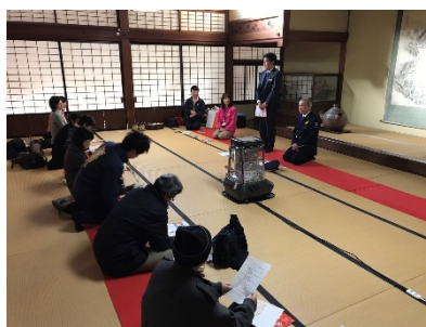
<豊川稲荷での記者発表の様子>