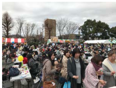
<体育館前広場会場の様子>