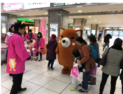
<JR 浜松駅でのPRの様子>