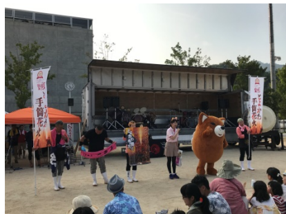
<とよかわ手筒花火・観光PRの様子>