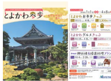
＜誘客促進ポケットティッシュ＞ ＜名鉄キャンペーン車内吊りポスター＞