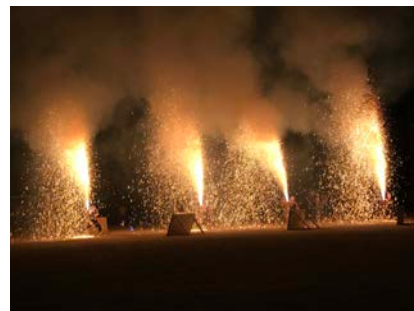
<とよかわ手筒花火>