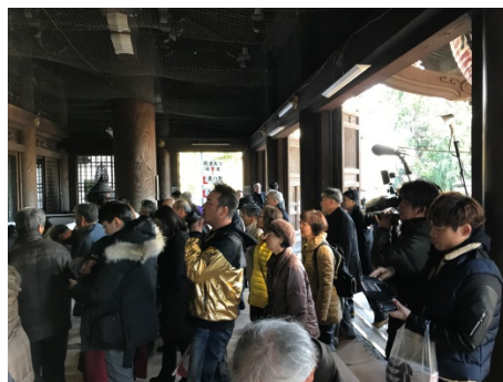
<サラサラサラダ撮影の様子> <東海TVスイッチ！収録の様子> <関西テレビ よーいドン！撮影の様子>