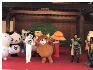
<岡崎イベントの様子>