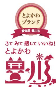
<とよかわブランドエンブレム>