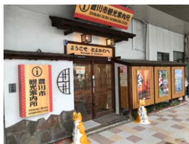
<移転した観光案内所>