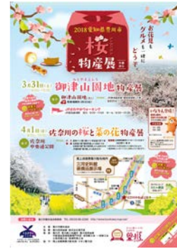
＜豊川稲荷春季大祭ポスター＞ ＜とよかわ手筒花火PRうちわ＞ ＜とよかわ桜物産展チラシ＞