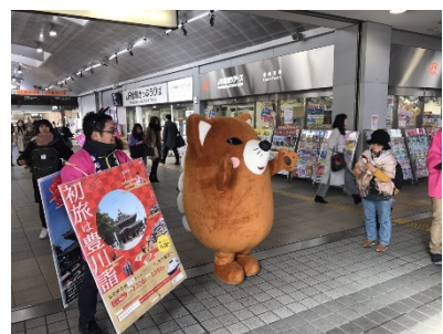
<JR 金山駅でのPRの様子>