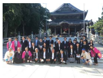
<門前でのご接待の様子> <販売会議狐お面絵付体験の様子> <エクスカーション参加旅行会社の皆様>