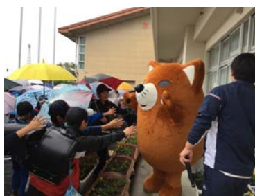
<東部小学校あいさつ運動の様子>