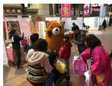
<四日市イベントの様子>