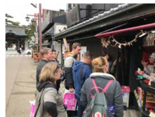
< トラベル&MICE 大商談会の様子 >