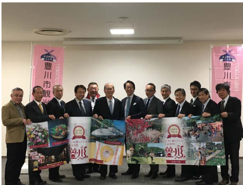
<記者発表会の様子>