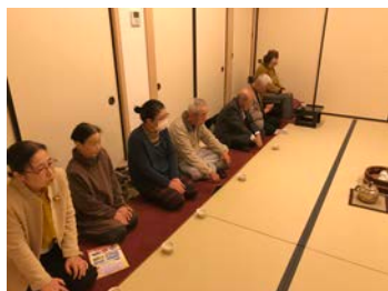
<仕事はじめ式の様子>