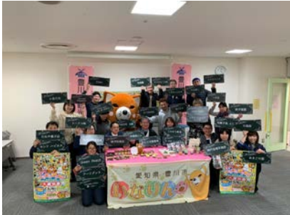
<観光物産展参加店記者発表の様子>

協賛は、(株)ハクヨーコーポレーション、(株)香月堂、山本製粉(株)、(株)伊藤園豊川支店、トヨタカローラ愛豊(株)、豊川市開発ビル、オートボックス(株)クライム、ヒカリレンタル(株)、フィリップモリスジャパン等、また、陸上自衛隊豊川駐屯地、日本車輛製造(株)、新東工業(株)より協力もいただきました。