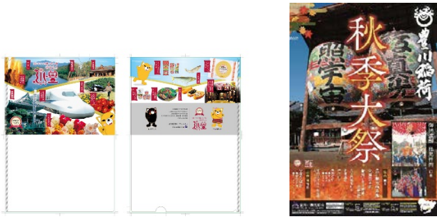
<とよかわブランドクリアファイル> <豊川稲荷秋季大祭ポスター>