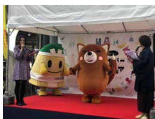
<東京・有楽町出展の様子>