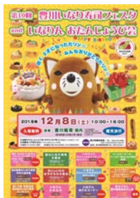
<いなりんお誕生日会ポスター>