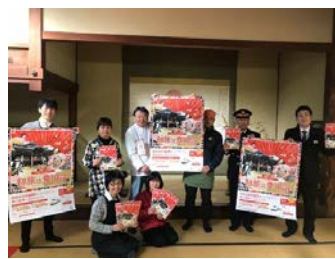
〈豊川稲荷での記者発表〉