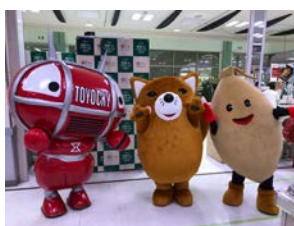
<岡崎市出展の様子>