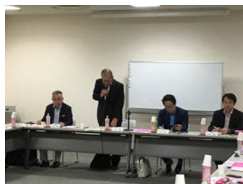
<理事監事会の様子>