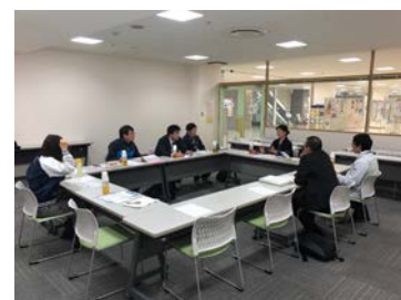
<市内宿泊施設意見交換会>