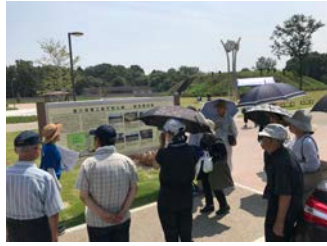
<御油夏まつり視察様子>