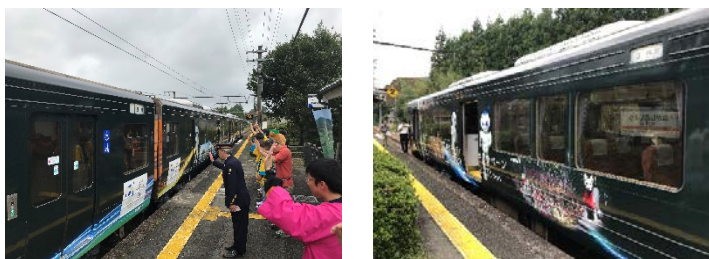
<車両に、豊川稲荷霊狐塚写真が掲載>

内容 豊橋駅から新城駅間の車内にて弥次さん&喜多さん衣装で豊川市をPRとよかわブランド「とよかわバウムクーヘン」のお振舞いも好評でした。