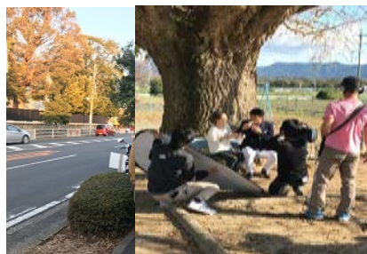
<SKE 特典撮影の様子 ロケ>