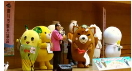
<閉会式表彰式の様子>