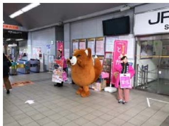
〈JR 金山駅で PR〉