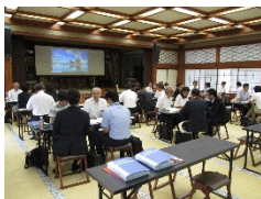
<三遠南信伊勢志摩インバウンド商談会>