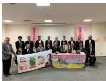
<記者発表会の様子>