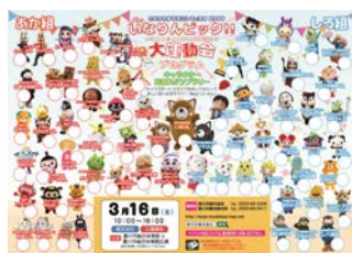
<いなりんピックプログラム>