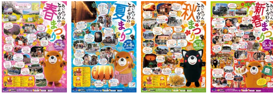
<とよかわまつりPRポスター>