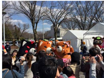
<体育館前広場会場の様子>