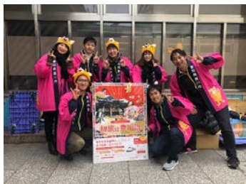
〈JR 名古屋駅での PR〉