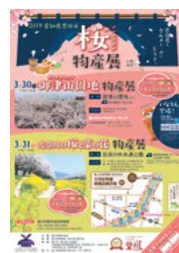
<とよかわ桜物産展チラシ>