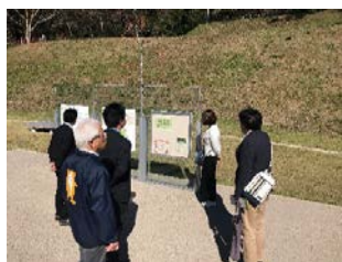
※小牧市観光協会訪問の様子