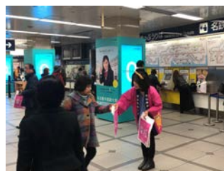
〈パンフレット・ポスターデザイン〉〈名鉄系統板 PR〉〈名鉄名古屋駅にてキャンペーンの様子〉