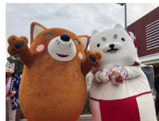
<静岡県磐田市出展の様子>