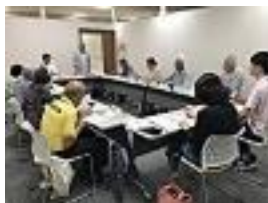
<意見交換会の様子>