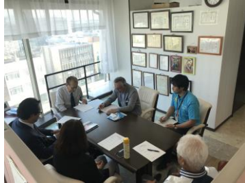
<正副会長会議の様子>