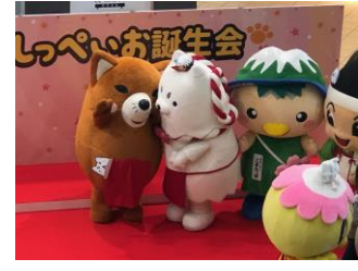
<ご当地キャラ博 in 彦根出展の様子> <東京・有楽町出展の様子> <静岡県磐田市出展の様子>