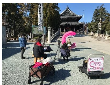
<中京テレビまんなかチュウキョ〜収録の様子>