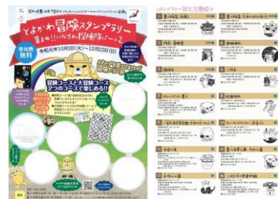
<ポスター・パンフレット>