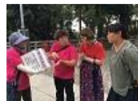
<手話ガイドの様子>