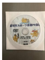
豊川市スポーツ合宿PR動画 DVD 500枚作製