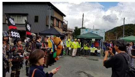
<長篠城駅でのおもてなしの様子>