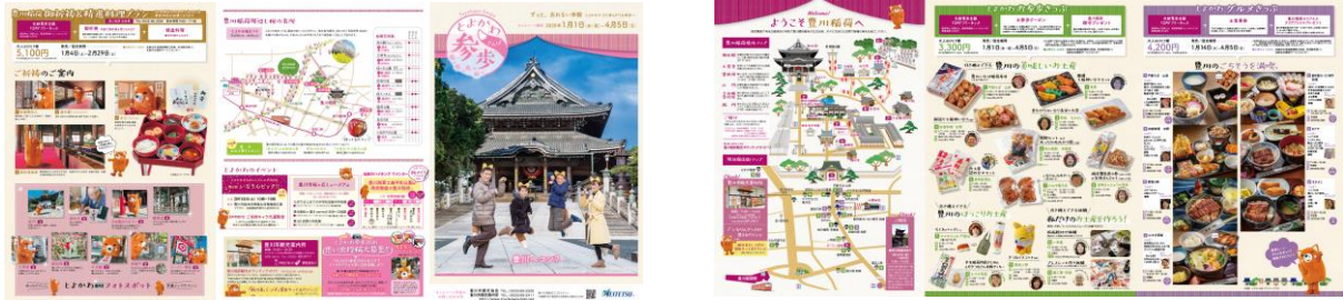
<パンフレットデザイン>