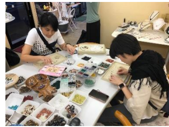
<台湾における情報発信事業 豊川稲荷ガイドと豊川いなり寿司作り、プレスレット作りの様子>