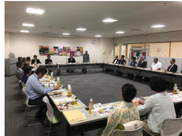
<理事監事会の様子>