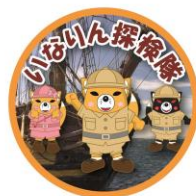
<観光資源制覇でお渡したカンバッジ>