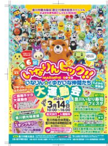
<豊川稲荷 春季・秋季大祭ポスター>