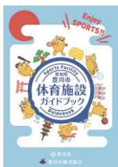
豊川市体育施設ガイドブック 10,000部作製