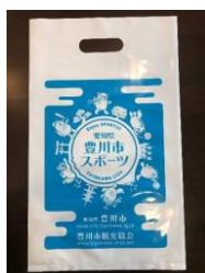
PR 営業用ビニールバック 10,000枚作製