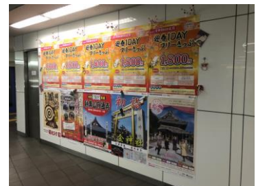
<名鉄名古屋駅でのPRの様子>