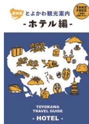
とよかわ観光案内ーホテル編ー 10,000部作製