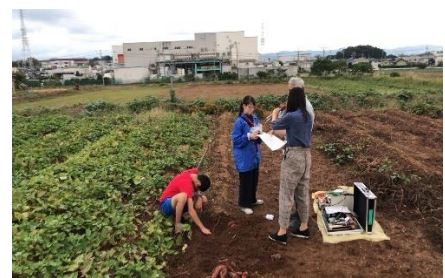
<CBC ラジオ千両さつまいも取材の様子>