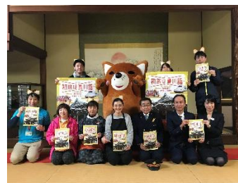
＜豊川稲荷での記者発表＞