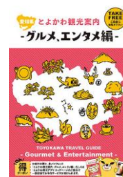
とよかわ観光案内ーグルメ・エンタメ編 10,000部作製